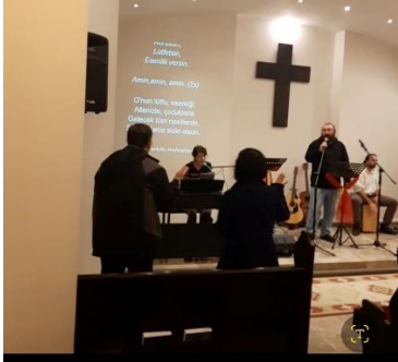
교회연합 12 시간 연속예배와 기도

라마단 금식기간 마지막 주간에 권능의 밤이 시작되는 3 월 16 일부터 3 월 19 일까지 기도의 집과 현지교회 연합으로 100 시간 연속예배와 기도회를 합니다. 올해 라마단 금식은 2 월 18 일부터