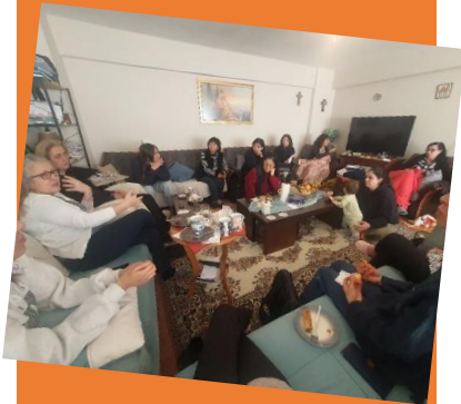
부활교회 여성모임에서 나눔의 시간